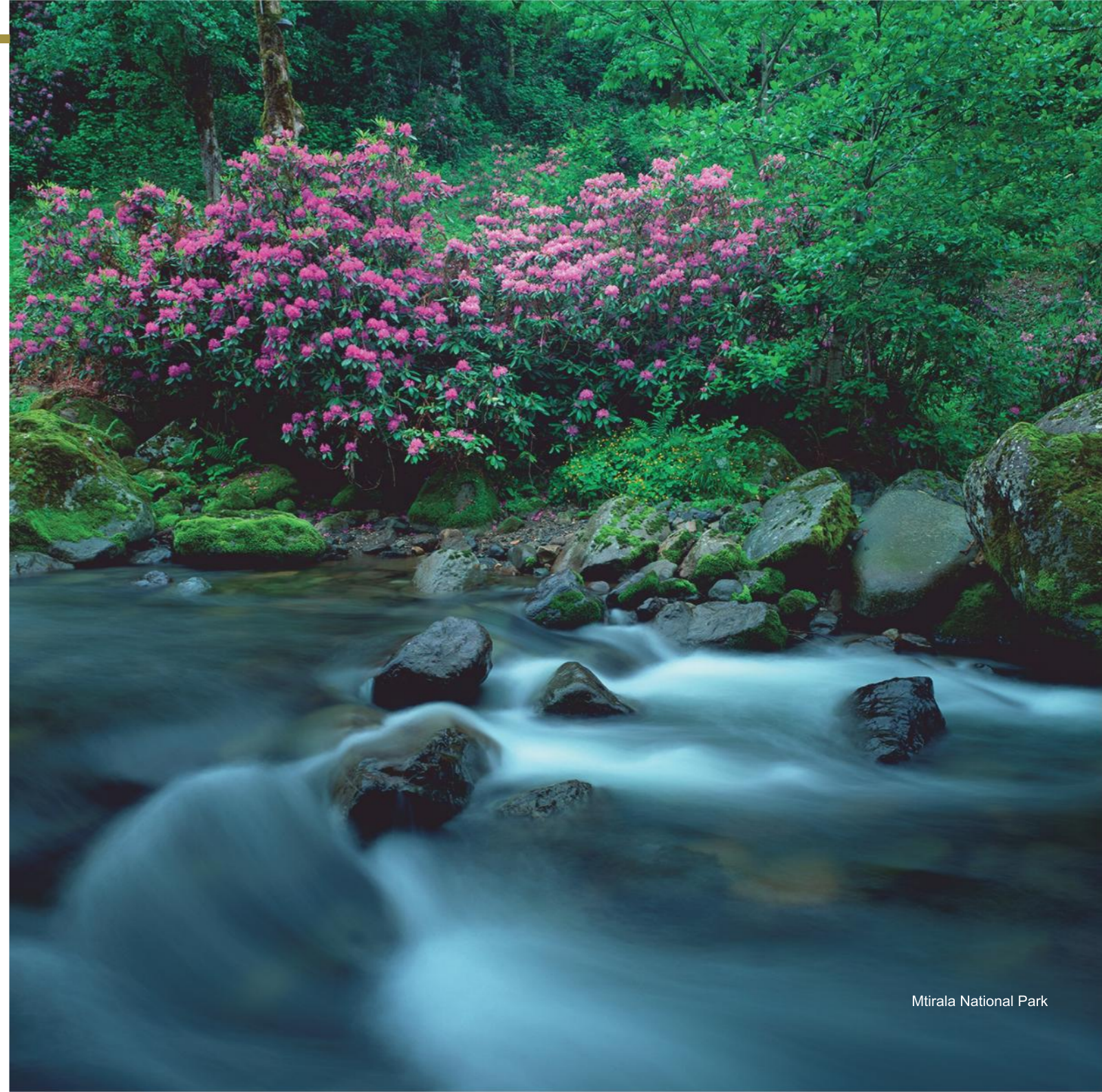
Mtirala National Park