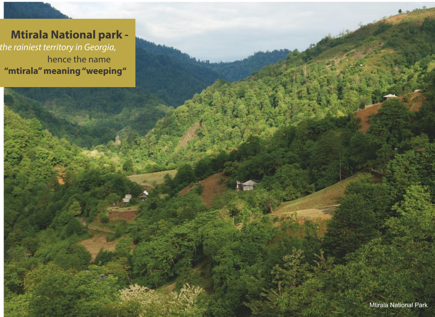
Mtirala National Park

Mtirala National park - the rainiest territory in Georgia, hence the name “mtirala” meaning “weeping”