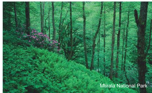
Mtirala National Park

В национальном парке Мтирала в настоящее время функционирует 2 туристских маршрута. Первый маршрут является познавательно-развлекательным, связывая два объекта – водопад и озеро. В течение 4 часов вы путешествуете по широколиственному смешанному лесу колхидского типа, затем поднимаетесь по ущелью р. Чаквисцкали по тропе, ведущей к красивейшему водопаду, высота которого 15 м. Поодаль, примерно в 200 м от водопада, расположены стоянки для палаток. Посетитель может остановиться в местном центре визитёров, познакомиться с сельскими традициями, попробовать национальные блюда, а также собственными глазами увидеть процесс производства меда.