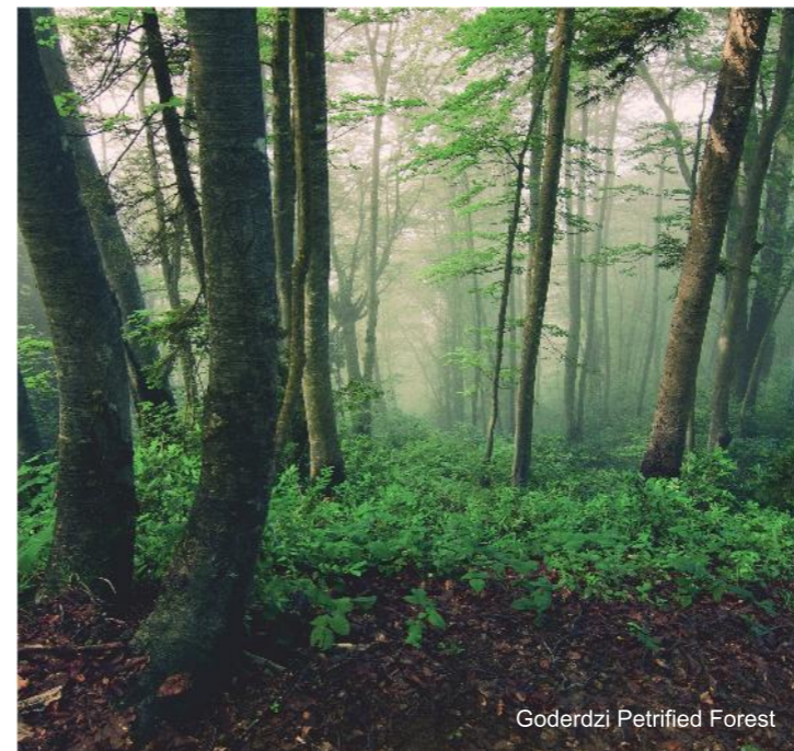
Goderdzi Petrified Forest

Tourists are particularly attracted by the beautiful lake located in the northern part of the Arsiani Range (Khulo Municipality). The local population calls it "Mtsvane Tba," or Green Lake. It is situated between huge mountains and is surrounded with spruce and beech trees. The lake is nourished by ground waters. Clear and transparent water is slightly mineralized and tourists can taste it on the spot.