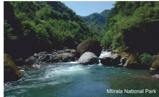
Mtirala National Park

თუ ორდღიანი 15 კმ-იანი საცხენოსნო-სალაშქრო ბილიკით გასეირნება გსურთ მარშრუტი „ცივწყარო“ - დაგაინტერესებთ. გარდა უნიკალური ფლორა-ფაუნის ნახვისა ბილიკზე მრავალი ბუნებრივი წყარო შეგხვდებათ, სადაც ვიზიტორებისთვის საპიკნიკე ადგილები და სველი წერტილებია მოწყობილი. ბილიკის ბოლოს კი არის ტურისტთა თავშესაფარი 8 კაცზე. აქვე მოწყობილია საპიკნიკე ადგილები, საიდანაც ხელუხლებელი ტყის ეკოსისტემების ულამაზესი ხედები მოჩანს. მარშრუტის მეორე დღე ხელუხლებელი დიდხონიანი ნიფლის კორომებში მოგზაურობას ეთმობა. ამ უნიკალურ პარკში ანთროპოგენური ზემოქმედების კვალიც არ არის.