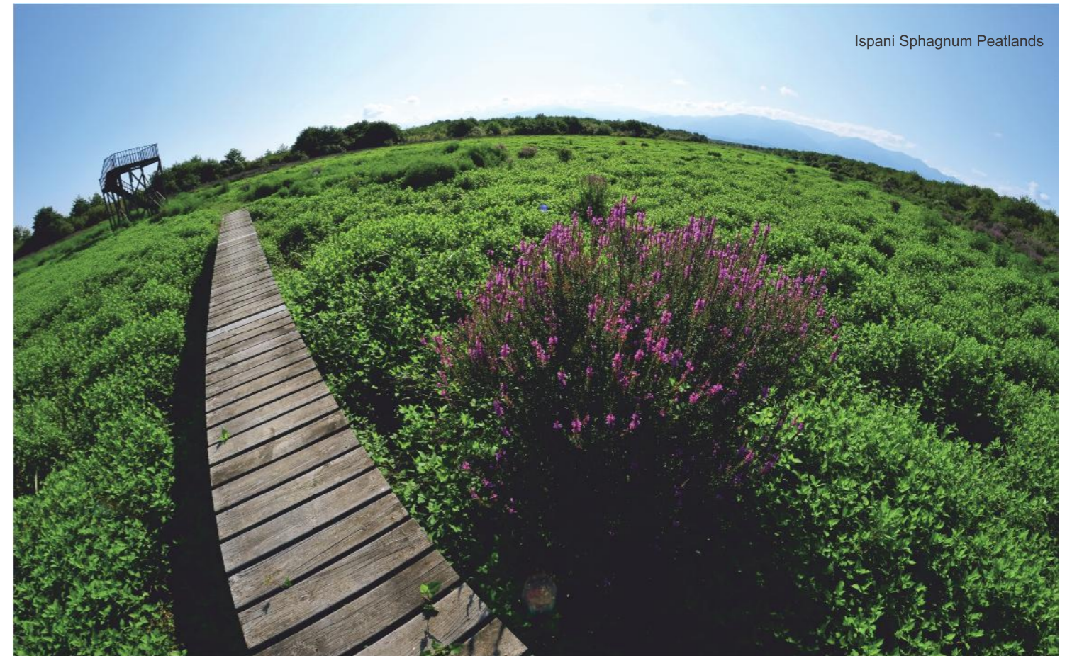
Ispani Sphagnum Peatlands

Ispani Sphagnum Peatlands - Approximately 30 km from Batumi, this protected area stretches over 770 hectares and comprises the Kobuleti Strict Nature Reserve (Ispani I) and Kobuleti Managed Nature Reserve (Ispani II). It represents a unique percolation-type wetland of international RAMSAR Convention importance and is considered as wet area for wintering birds.