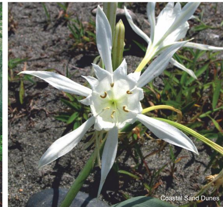
Coastal Sand Dunes