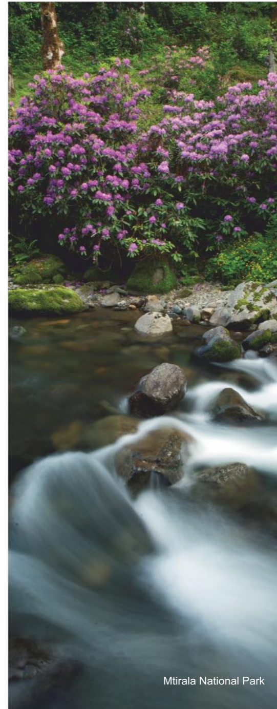
Mtirala National Park