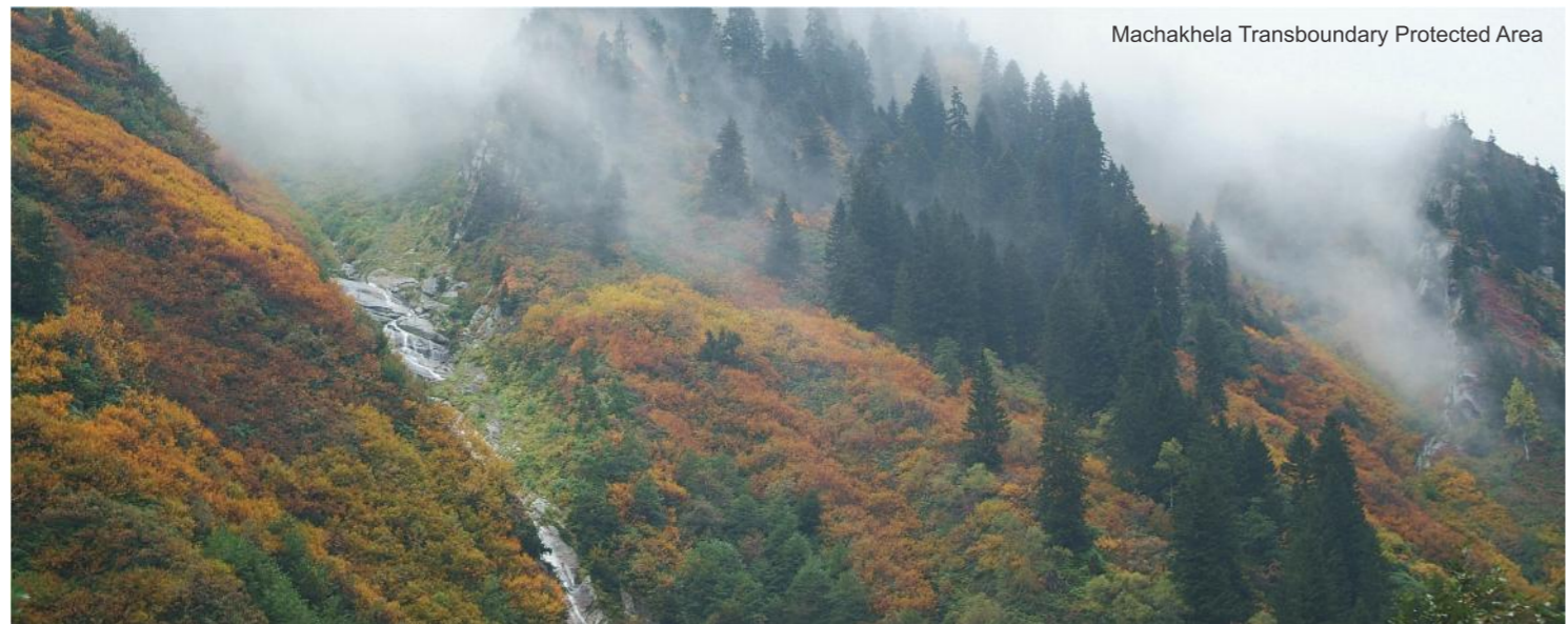
Machakhela Transboundary Protected Area

Приоритетными в программах сохранения редких и находящихся под угрозой исчезновения видов животных и растений являются: кавказская пчела, бурый медведь, каспийский улар, кавказская саламандра, тис, чорохский дуб, венгерский рододендрон, лазурный ирис.