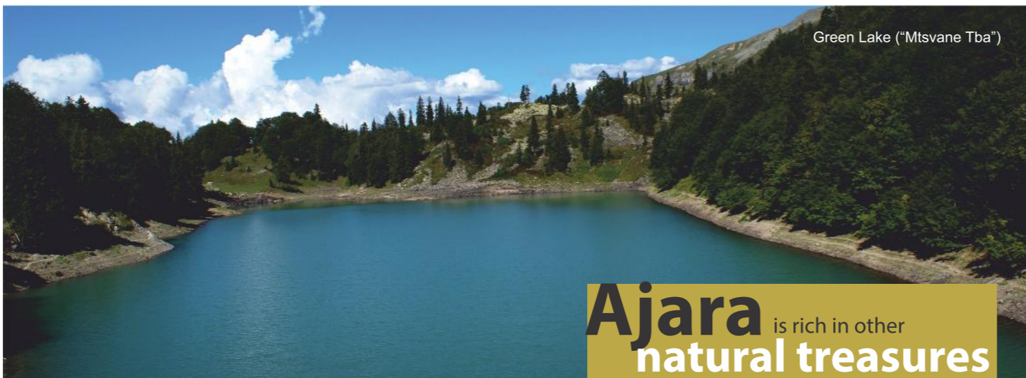
Green Lake ("Mtsvane Tba")

Ajara is rich in other natural treasures